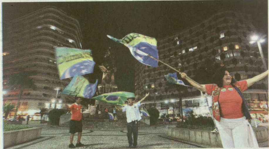
Chefes das campanhas dos dois candidatos a presidente na região descartam diferenças partidárias