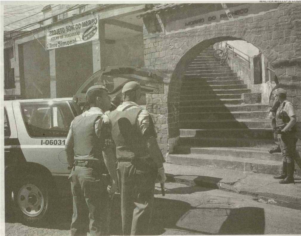
A presença da polícia na rua: uma forma sempre eficaz para a redução no número da criminalidade